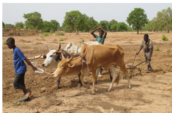
Muchos factores conducen a las pérdidas poscosecha.

Mientras que en los países desarrollados el peor problema asociado a las pérdidas tras la cosecha es la comida que se desecha, pero podría consumirse, en los países pobres radica en el proceso de producción. La situación es particularmente negativa si se trata de fruta y verdura. En África, la mitad de estos alimentos nunca llega al plato.