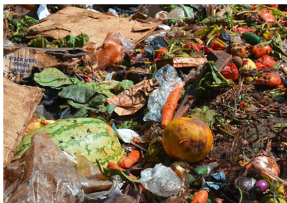
En los países industrializados se tiran muchos alimentos.

La Organización de las Naciones Unidas para la Alimentación y la Agricultura concluyó en un estudio de 2011 que se pierde un tercio de los alimentos producidos en todo el mundo para consumo humano, es decir, 1.300 millones de toneladas al año.